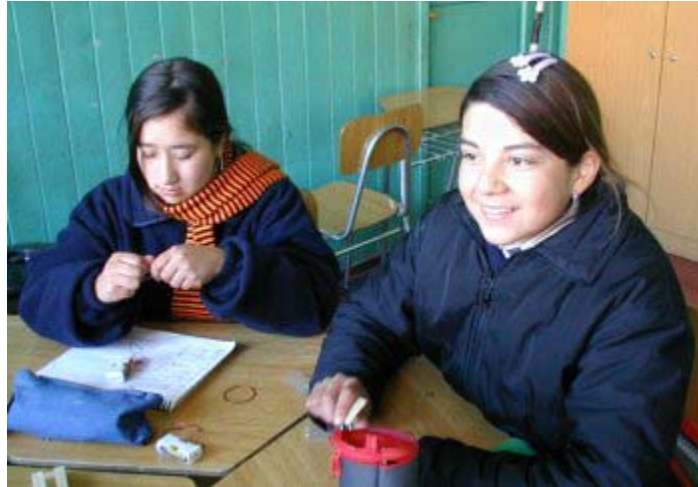
5. Se sigue el trabajo de manera entusiasta