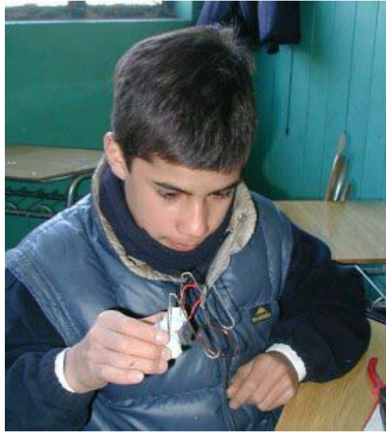
7. Otro motor en funcionamiento