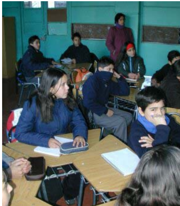
1. Los grupos al inicio de la sesión de trabajo

La electricidad es en verdad un vector energético que se ha tornado indispensable en la vida moderna. Nos brinda iluminación, calor, energía y permite que funcionen múltiples utensilios como computadores, teléfonos, televisores, radios, máquinas herramientas y centenares de artefactos más. De hecho la electricidad está tan presente en nuestras vidas que no es posible concebir el mundo que conocemos sin ella.