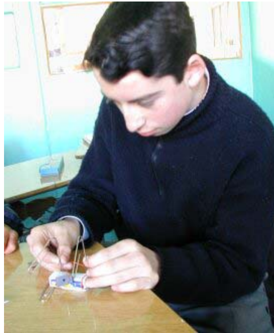
6. El primer motor que funcionó