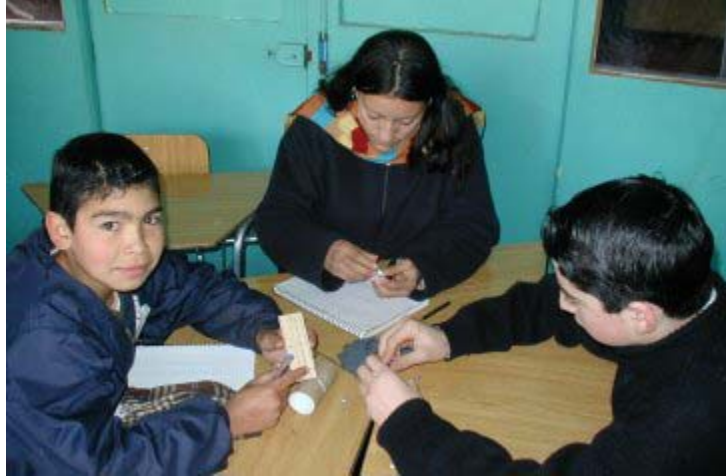
2. Comenzando a fabricar el motor

Una característica básica de la electricidad es el voltaje . Esta característica es análoga a la presión que puede tener el agua en una tubería. Mientras más presión tiene el agua, necesitamos menos cantidad de ella para hacer el mismo trabajo. Asimismo mientras más voltaje tiene una fuente eléctrica, necesitamos menos corriente para hacer el mismo trabajo.