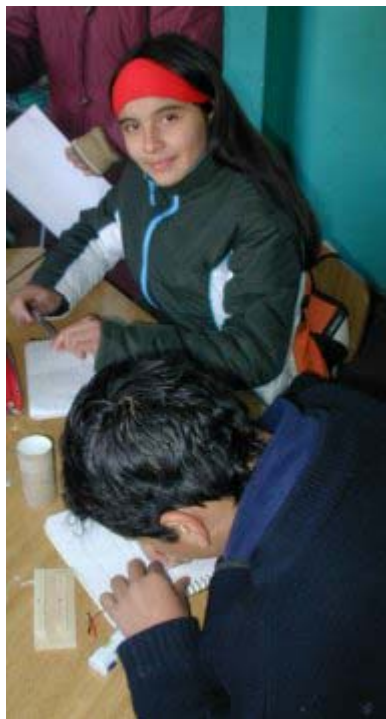
3. Otro grupo en pleno trabajo

A nivel doméstico la energía viene en 220 Volts. Una batería de auto genera 12 Volts. Para transmisión a mayores distancias se utilizan voltajes que van desde los 13.000 a más de 300.000 Volts. En este último caso se puede transmitir energía eléctrica a centenares de kilómetros de distancia.