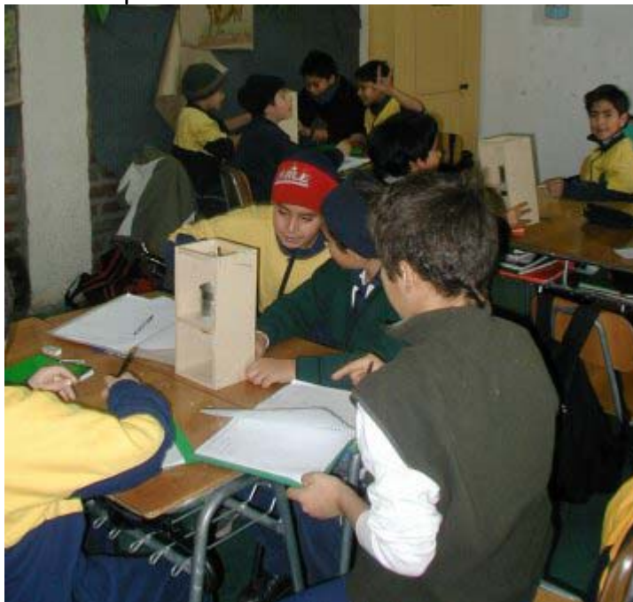
Foto 3: En las primeras etapas del armado del motor Stirling a vela

Pero hoy deseamos hablar de una actividad sumamente concreta que desarrollamos con los chicos y chicas de 5º Año Básico del Colegio El Sauce. Se trató de una clase experimental sobre fuerza y movimiento. El objetivo es aprender a través de la experimentación como uno puede convertir calor en movimiento.