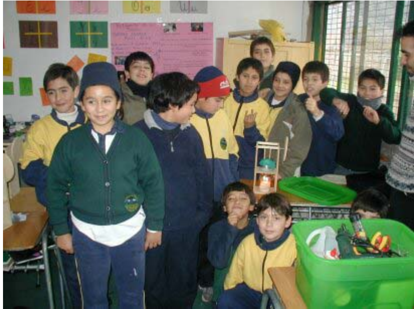
Foto 6: El curso completo con uno de los motores en funcionamiento. La cara de alegría muestra la satisfacción de la meta lograda.